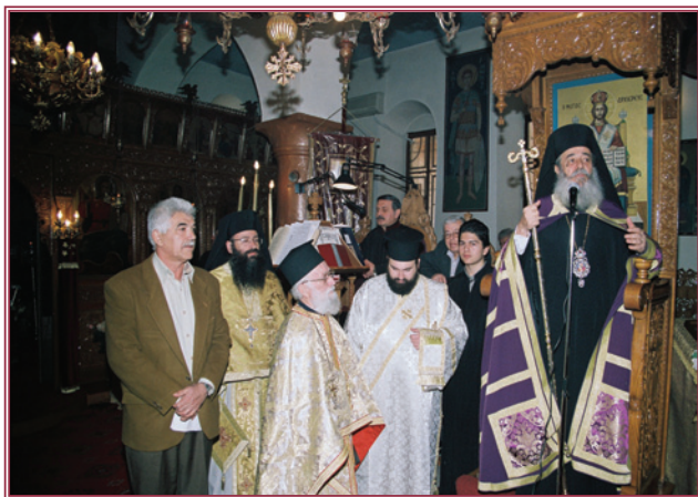
Ἀπό τή Θεία Λειτουργία στόν Ἱ. Ν. Ἁγ. Δημητρίου στό Ἄμυρι.

Τήν Κυριακή 2 Ἰανουαρίου ὁ Σεβασμιώτατος Μητροπολίτης μας χοροστάτησε καί ὠμίλησε στόν Ἱερό Ναό Ἁγ. Δημητρίου Λαμίας καί στήν συνέχεια μετέβη στόν Ἱερό Ναό