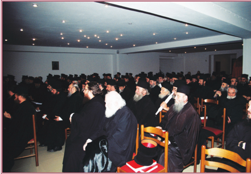
Ἀποψη τῆς κατάμεστης ἀπὸ ἱερεῖς αἴθουσας τοῦ Πνευματικοῦ Κέντρου Ἁγίας Παρασκευῆς Λαμίας.

Β) Θεωροῦμε πληγμὰ καὶ χαριστικὴ βοήθῃ στὴν πληγωμένη συνειδηση τοῦ λαοῦ μας τὴν ἐπιχειρουμένη ἀπὸ μερικοὺς ἀποκαθίλωση τῶν Ἐκκλησιαστικῶν καὶ Ἐθνικῶν Συμβόλων. Ἄλλο ἔρευνα καὶ ἄλλο προπαγάνδα. Ἄλλο σεβα-