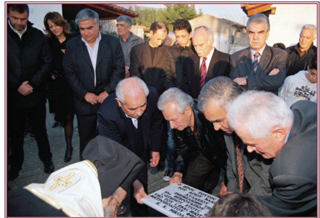
Η τοποθέτηση του θεμελίου λίθου από τον Σεβασμιώτατο Μητροπολίτη μας.

μάρτυρος Βλασίου, Ίπισκόπου Σεβαστείας, χρονολογείται από τό 1920 και κρίνεται άκατάλληλος για νά στεγάσει τίς λατρευτικές ακολουθίες της ένορίας. Μετά την τελετή θεμελίωσης ό Σεβασμιώτατος χοροστάτησε στον πανηγυ-