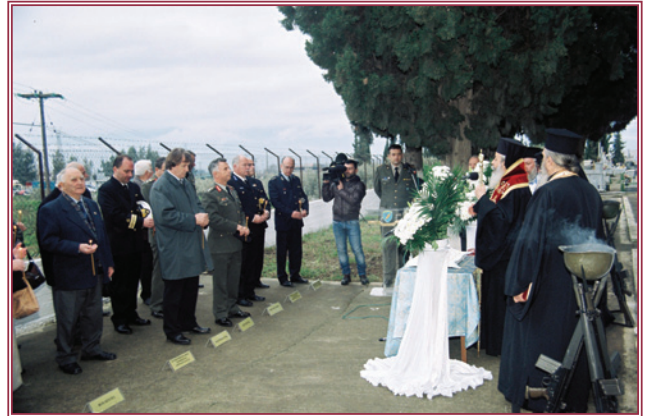
Ἀπό τήν ἐπιμνημόσυνη δέηση στό Στρατιωτικό Νεκροταφεῖο.

Ἐπιμνημόσυνη δέηση στό στρατιωτικό νεκροταφεῖο Λαμίας τελέσθηκε, τό Σάββατο 26 Φεβρουαρίου, ὑπέρ τῶν πεσόντων στους ἱεροῦς τοῦ Ἔθνους ἀγῶνες, ἀλλά καί τῶν τελειωθέντων κατά τήν εἰρηνική περίοδο στρατιω-