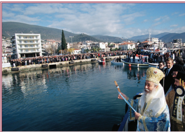
Ἀπὸ τὴν τελετὴ τοῦ Ἀγιασμοῦ τῶν ὕδατων στὴ Στυλίδα.

Μετὰ λαμπρότητα ἐορτάσθηκε τὴν Πέμπτη 6 Ἰανουαρίου, ἡ ἐορτὴ τῆς Βαπτίσεως τοῦ Κυρίου μας Ἰησοῦ Χριστοῦ καὶ τῆς Θεῆς Ἐπιφανεῖας στὴ πόλη τῆς Στυλίδος. Τῶν ἐορτα-