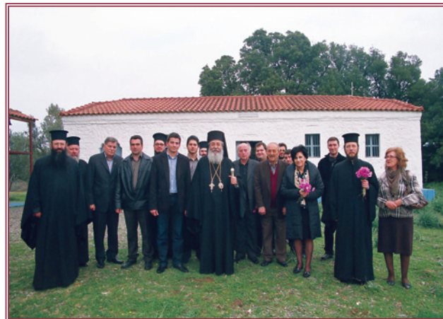
Ὁ Σεβασμιώτατος μέ κατοίκους τοῦ χωρίου Κομποτάδες.

Ἁγ. Γεωργίου Λαμίας ὅπου μίλησε στό Ἐκκλησίασμα. Τήν Δευτέρα 3 Ἰανουαρίου χοροστάτησε καί ὠμίλησε στή Θεία Λειτουργία στό πανηγυρίζον παρεκκλήσιο τοῦ Ἁγίου Ἐφραίμ τοῦ Κέντρου Νεότητος Λαμίας. Τήν Παρασκευή 9 Ἰανουαρίου χοροστάτησε καί ὠμίλησε στήν Θεία Λειτουργία στήν Ἱερά Μονή Παναγίας Δαμάστας, ὅπου εὐχήθηκε στήν ἑορτάζουσα Ἥγουμένη Ἰωάννα. Τήν Παρασκευή 4 Φεβρουαρίου πραγματοποίησε ποιμαντική ἐπίσκεψη στίς ἐνορίες Καμ. Βούρλων, Ἁγ. Κωνσταντίνου Λοκρίδος,