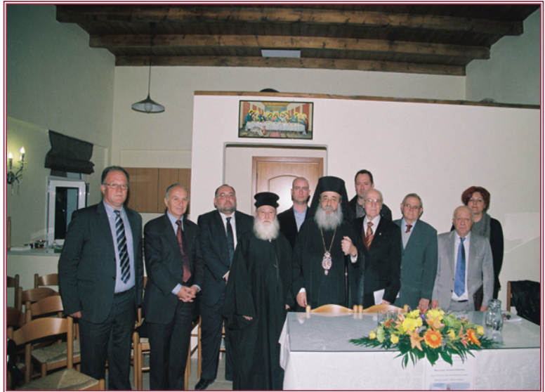
Ὁ Σεβασμιώτατος μὲ τοὺς συντελεστὲς τῆς Ἑσπερίδας, στὸ Κόμμα.

Με επιτυχία στέφθηκε ἡ 2η γιὰ τὸ ἔτος 2011 Θεολογικο-ιστορική Ἑσπερίδα πού διοργάνωσε ἡ Ἱερά Μητρόπολις μας και πραγματοποιίησε τὸ Ἐκκλησιαστικὸ Συμβούλιο