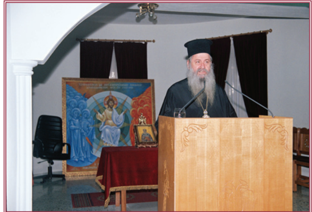
Ὁ Θεοφιλέστατος Ἐπίσκοπος Ρεντίνος σὲ βῆμα.

καὶ τὸν Φεβρουάριο τὸ θέμα: Ἐνορία καὶ Λειτουργικὴ Ζωή. Στὴν μνησαία σύναξη τῶν κληρικῶν τῆς Λαμίας στὸ Πνευματικὸ Κέντρο τοῦ Ἁγίου Ἀθανασίου Λαμίας, τὴ Δευτέρα 10 Ἰανουαρίου, ὁμιλητὴς ἦταν ὁ Θεολόγος κ. Γεώργιος Ἀποστόλου, μὲ θέμα: «Ἡ Ἐνορία ὡς Σῶμα Χριστοῦ»,