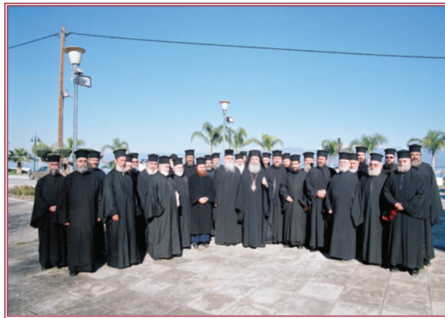
Ὁ Σεβασμιώτατος μέ τούς ἱερεῖς τῆς Συνάξεως στά Καμένα Βούρλα.

Ἁγ. Γεωργίου Λαμίας ὅπου μίλησε στό Ἐκκλησίασμα. Τήν Δευτέρα 3 Ἰανουαρίου χοροστάτησε καί ὠμίλησε στή Θεία Λειτουργία στό πανηγυρίζον παρεκκλήσιο τοῦ Ἁγίου Ἐφραίμ τοῦ Κέντρου Νεότητος Λαμίας. Τήν Παρασκευή 9 Ἰανουαρίου χοροστάτησε καί ὠμίλησε στήν Θεία Λειτουργία στήν Ἱερά Μονή Παναγίας Δαμάστας, ὅπου εὐχήθηκε στήν ἑορτάζουσα Ἥγουμένη Ἰωάννα. Τήν Παρασκευή 4 Φεβρουαρίου πραγματοποίησε ποιμαντική ἐπίσκεψη στίς ἐνορίες Καμ. Βούρλων, Ἁγ. Κωνσταντίνου Λοκρίδος,