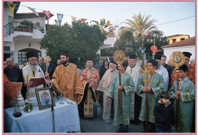
Άπό την θεμελίωση του Ίερού Ναού Άγίου Βλασίου Αύλακίου.

ού στην ένορία Αύλακίου ήταν αίτημα και άπαίτηση όλων των κατοίκων της κοινότητας καθώς ό παλαιός Ίερός Ναός, ό όποιος και αυτός τιμάται έπ' όνόματι του άγίου Ίερο-