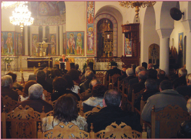
Από την θεολογικο-ιστορική έσπερίδα στὸν Ἅγιο Λουκά Λαμίας.

Με επιτυχία πραγματοποιήθηκε την Κυριακή, 23 Ιανουαρίου 2011 και ώρα 5:00 μ.μ., η έκ της Ίερῆς Μητροπόλεως