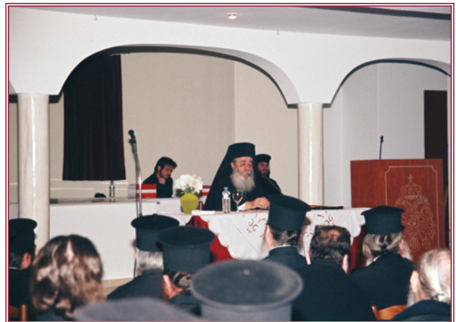
Στὸ βῆμα τοῦ Συνεδρίου, ὁ Σεβασμιώτατος Μητροπολίτης μας.

σμός τῆς διαφορετικότητας καὶ ἄλλο ἐμπαιγμός τῆς μοναδικότητας. Ἐπειδὴ ὅλοι ἔμεῖς οἱ ἱερεῖς τῆς Φθιώτιδος προερχόμεθα ἀπὸ ἥρωες καὶ ἀγωνιστές τῆς Ἐθνεγερσίας τοῦ 1821 καὶ τῆς Ἀντιστάσεως τοῦ 1940, ἠμπούμεθα καὶ εἴμαστε προβληματισμένοι πού ἡ Ἐθνικὴ Τράπεζα, μὲ τὴν ὁποία ἡ Ἐκκλησία εἶχε καλὴ συνεργασία καὶ οἱ ἐνορίες, τὰ μοναστήριά μας καὶ πολλοὶ ἐκ τῶν προσώπων τῆς Μητροπόλεως μας ἔχουν τίς καταθέσεις τους ἐκεῖ, χρηματοδότησε τὸ ὑβριστικὸ ἔργο γιὰ τὸ 1821.